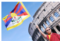
Tibet: corteo di solidarietà a Roma