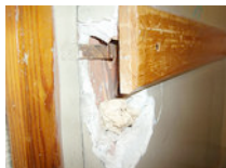
Il degrado nelle scuole italiane